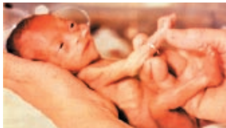
Ребенок на 21 неделе родился живым. (фото тремя неделями позже).

Аборт с помощью кесарева сечения (гистеротомия). Этот метод достаточно стандартен до момента отсечения пуповины. При Кесаревом сечении отсасывается слизь ребёнка, и ему оказывается интенсивная терапия в инкубаторе для новорождённых, где делается всё для его выживания. При аборте данным способом отсечённый от пуповины ребенок кладется в ведро и оставляется умирать, а после просто выбрасывается в печь.