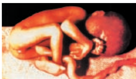
Ребенок на 21 неделе, убитый абортом.