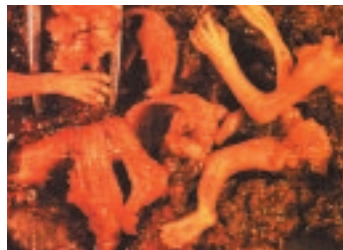
Вот что осталось от 10-недельного ребенка, убитого вакуумным абортом.